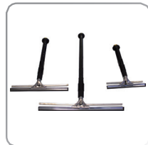
Fönstervätt med ångspridare 250 mm art. nr. 7002522 350 mm art. nr. 7003522 450 mm art. nr. 7004522