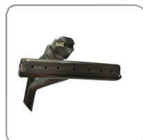
Ångspridare med högtryck art. nr. 7200122