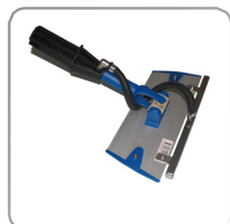
Ångmopp med led 220 mm, (används tillsammans med en ångslang) art. nr. 7002069