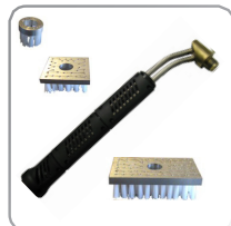
Dubbellans med gäng art. nr. 7200112 Borstar med gäng (finns i nylon, mässing och rostfritt stål) Ø 35 mm art. nr. 7203522 60x60 mm art. nr. 7203522 100x60 mm art. nr. 7203522