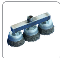
Golvskrubbsborste, art. nr. 1200002