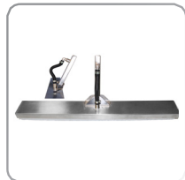
Brush flex joint 250, art. nr. 7000252V1 Brush flex joint 350, art. nr. 7000352V1 Brush flex joint 450, art. nr. 7000452V1